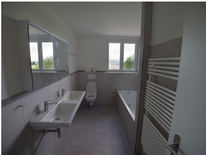
Bad mit Doppellavabo, WC und Badewanne