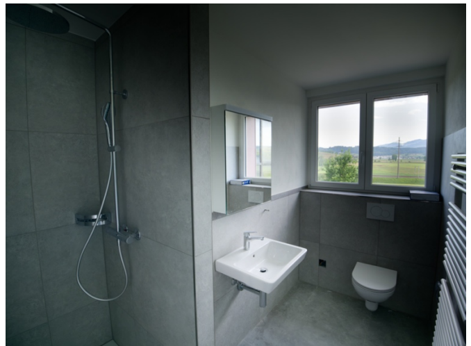
Separates WC mit Dusche und Lavabo