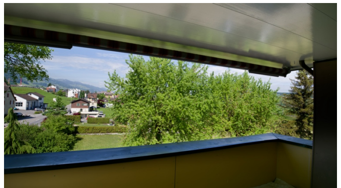
Grosser Balkon mit Sicht ins Grüne