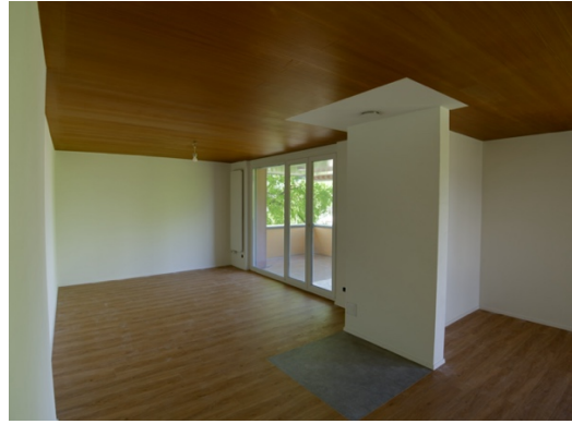
Wohnraum mit grossem Balkon