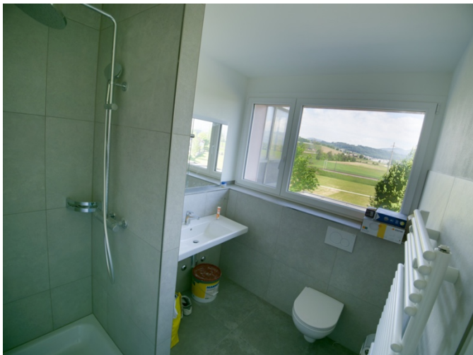
Duschbad mit Dusche, WC und Lavabo