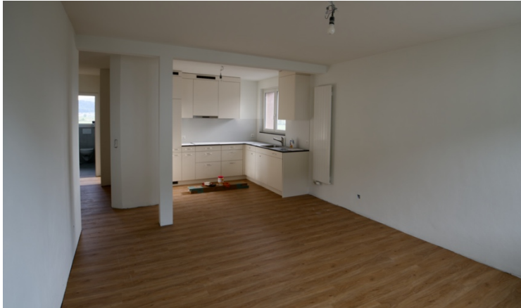
Küche und Wohnraum